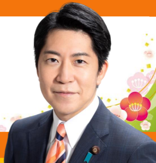
参議院議員 佐藤 啓

新年明けましておめでとうございます。 輝かしい新春を迎え、謹んでお慶び申し上げます。 昨夏の参議院議員選挙におきましては、奈良県行政書士政治連盟の先生方の絶大なるご支援を賜り、2期目の当選を果たすことができました。いま一度初心に帰り、国民の皆様の夢や願い、不安や悩みに寄り添い、全身全霊で働かせていただく所存です。先生方の期待にお応えできるよう努めてまいります。